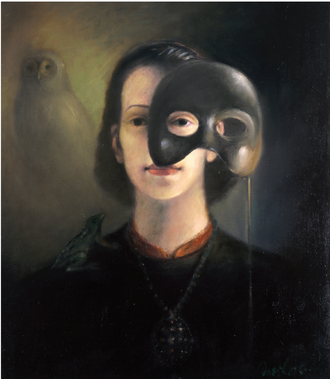
Devojka sa maskom, ulje na platnu, 80 x 60 cm