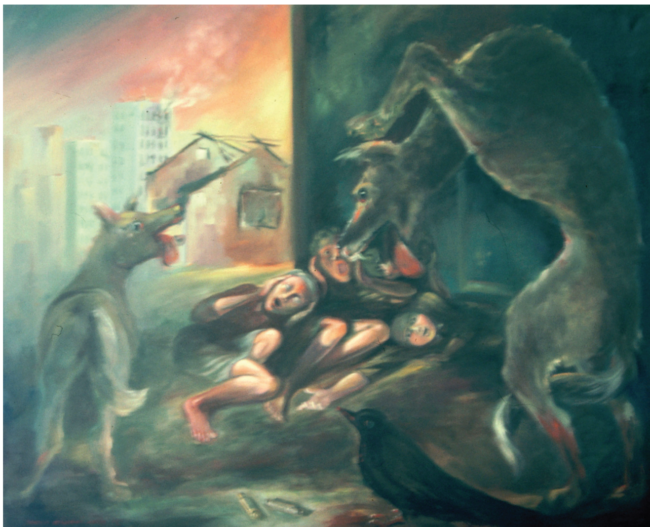
Strah , ulje na platnu, 60 x 80 cm