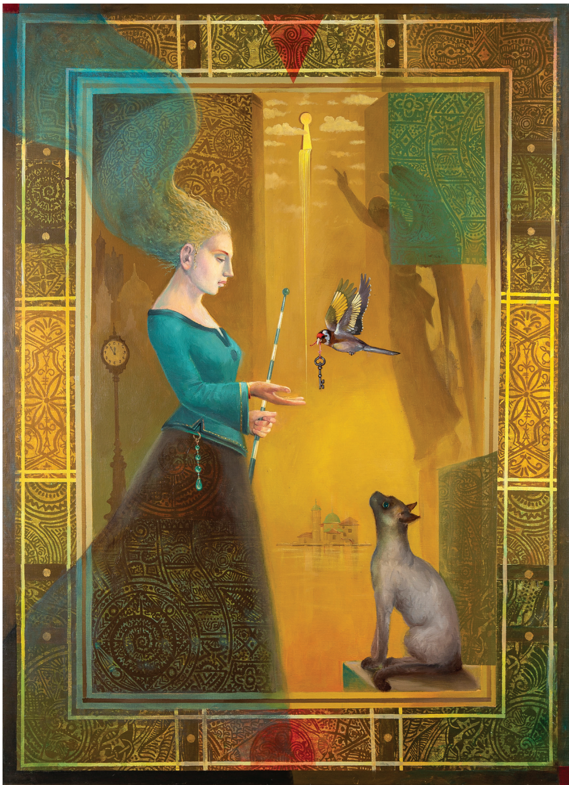
Ključ nadanja, ulje na platnu, 92 x 72 cm