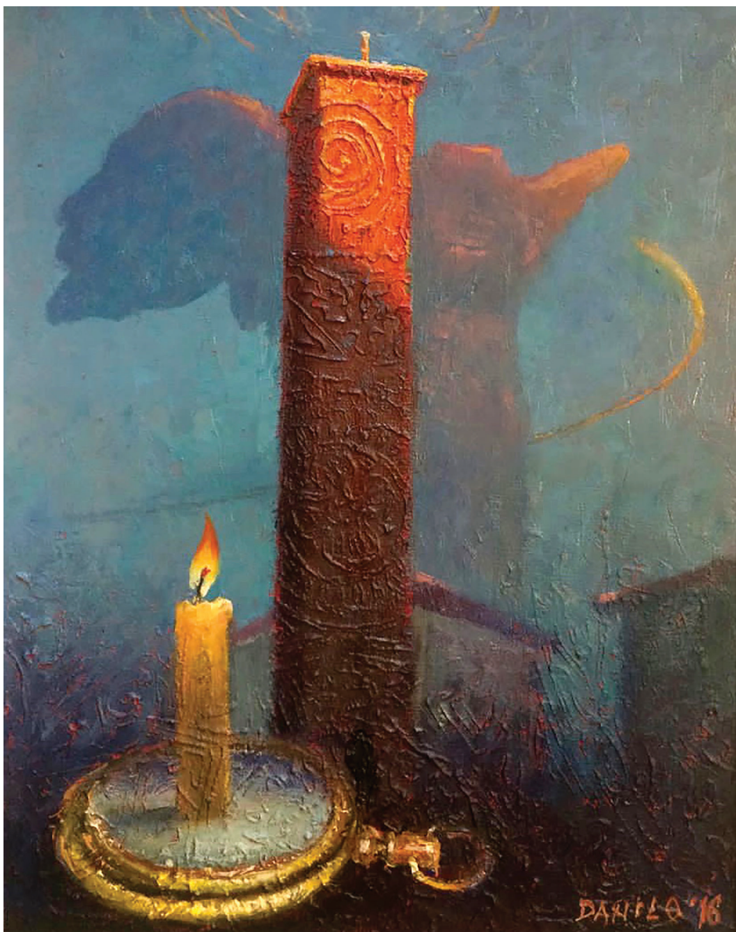
Sat-kula u Foči, svedok prolaznosti, ulje na platnu, 42 x 30 cm