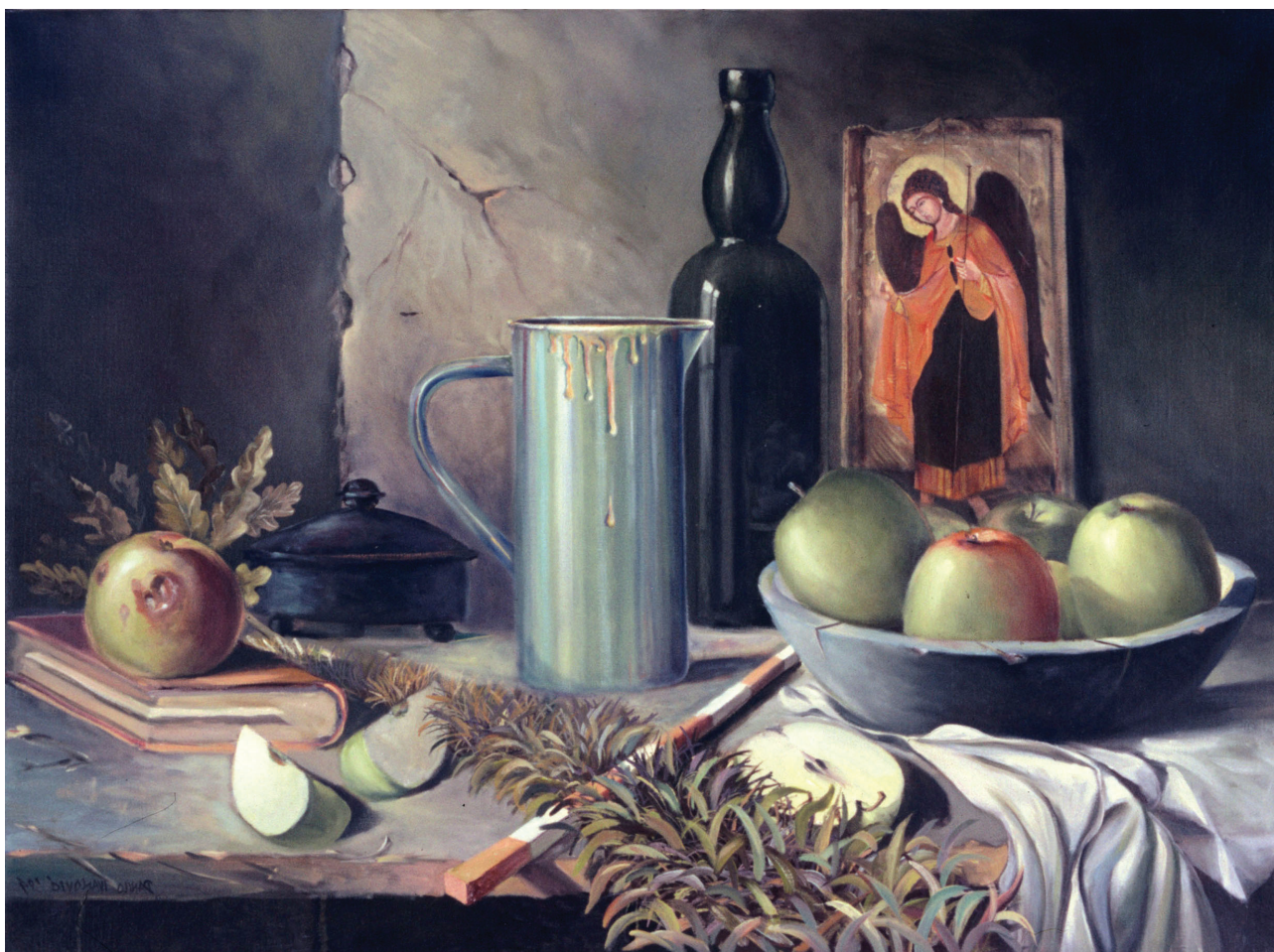
Mrtva priroda, ulje na platnu, 30 x 42 cm

piću, kafi, jelovniku. I takav razgovor mu je davao „pravo“ da ide na njihove izložbe kao na izložbe ljudi koje poznaje.