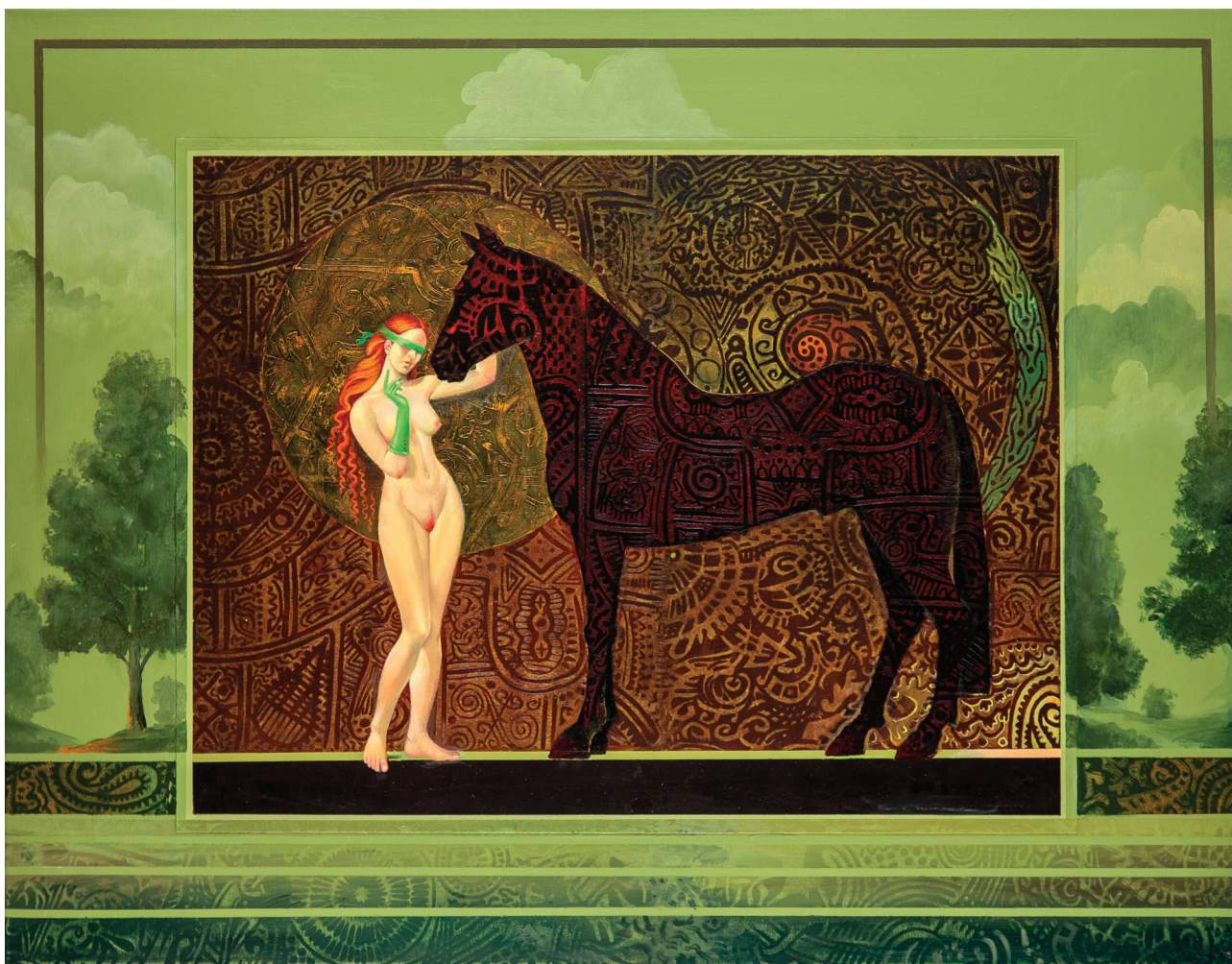
Devojka sa konjem, ulje na platnu, 72 x 92 cm

i da je originalnom umetniku nemoguće da izbegne uticaje prethodnika kojima se divi. U samo srce istine o fenomenu uticaja pogodio je još davno, u 18. veku, Gothold Efraim Lesing kada je ustanovio da „niko neće nekažnjeno šetati pod palmama“. Pisac ne može pročitati knjigu a da ona ne ostavi traga u njemu, niti slikar može proći kroz izložbu velikog prethodnika ili savremenika a da nešto nesvesno ne preuzme od njega. Nije veliki greh ni kada se nešto preuzme svesno i ugradi u sopstveno iskustvo, ali nesvesno preuzimanje je preuzimanje u prerađenom vidu, sa punom legitimnošću polaganja prava na preuzeto. Kada umetnik