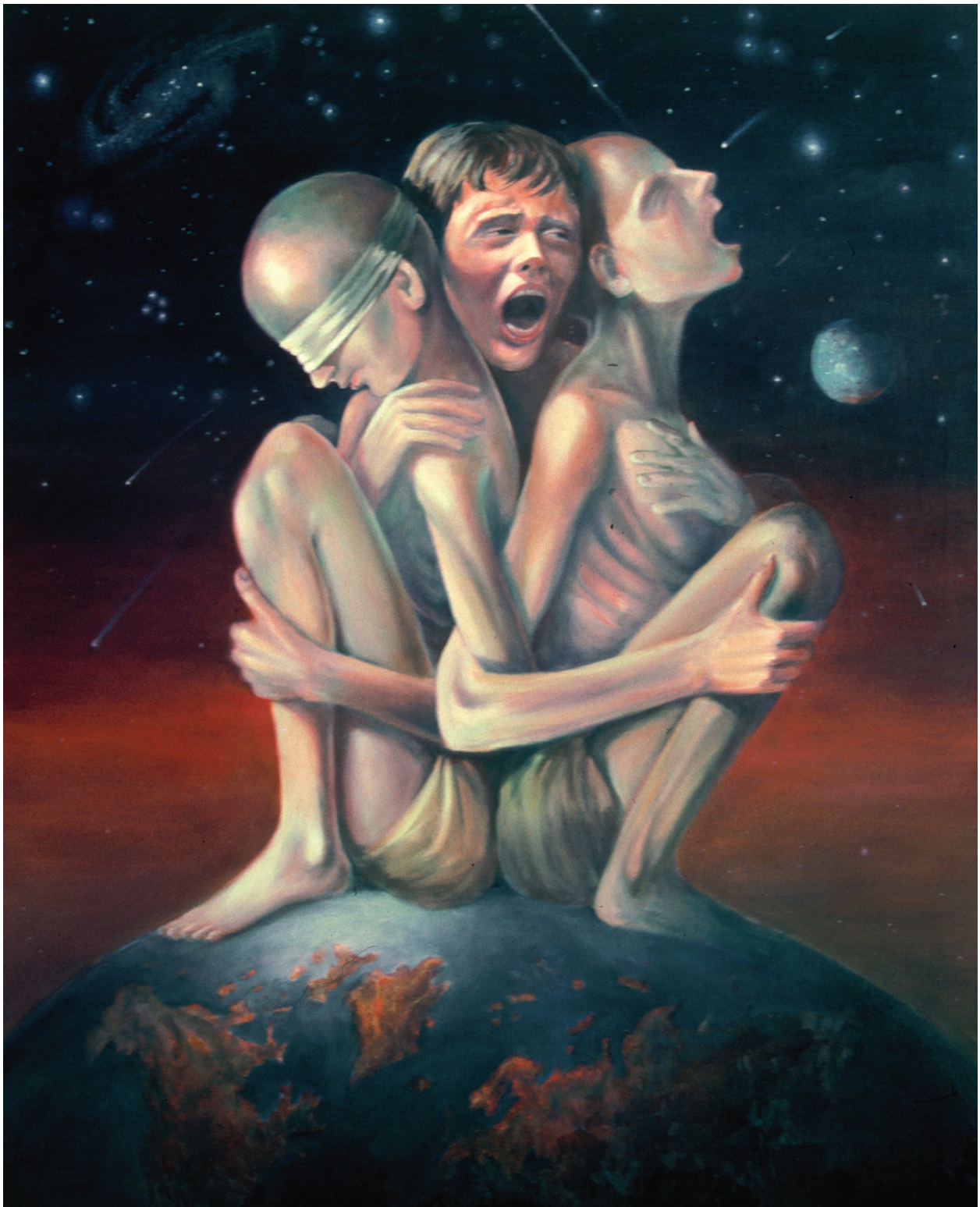
Krik dece u BiH, ulje na platnu, 100 x 82 cm