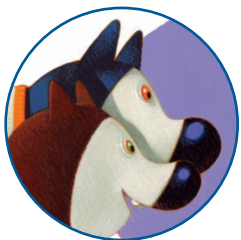
Мама и тата Платић