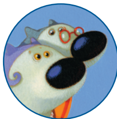
Бака и дека Платић