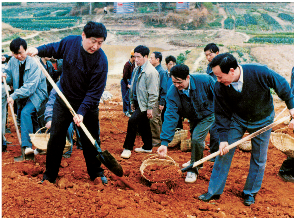
Pri pomaganju timu da se ojača nasip i spreči izlivanje donjeg toka reke Minđang u srezu Minhou, u decembru 1995. U to vreme bio je sekretar Gradskog komiteta KPK u Fudžouu u pokrajini Fuđian, i zamenik sekretara Pokrajinskog komiteta KPK u Fuđianu.