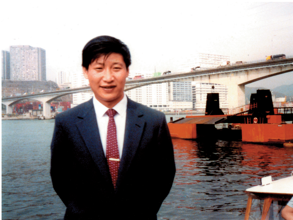
Ova fotografija je snimljena za vreme posete inostranstvu dok je bio zamenik gradonačelnika Sjamena u pokrajini Fuđian.