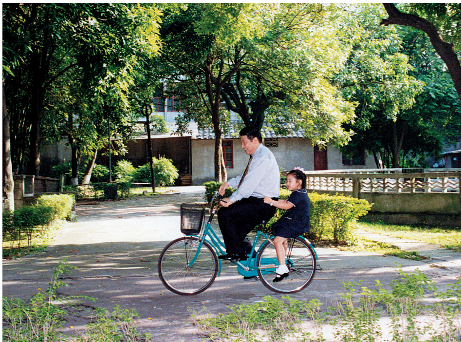
Sa ćerkom Mingce na biciklu u Fudžouu u pokrajini Fuđian.