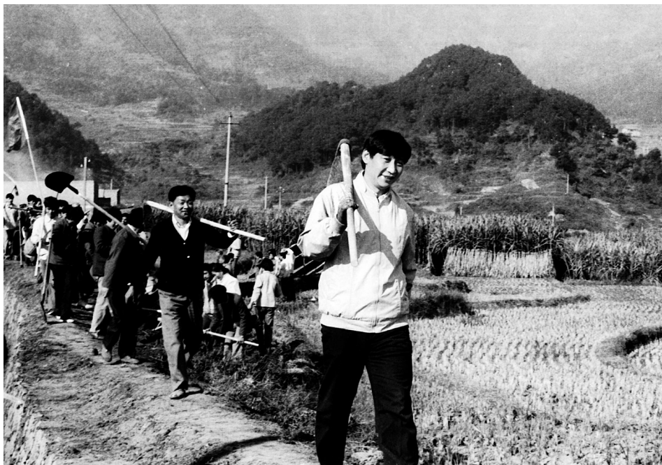
Zajednički rad sa meštanima tokom inspeksijskog obilaska iz 1989, kad je bio sekretar Okružnog komiteta KPK u Ningdeu u pokrajini Fuđian.