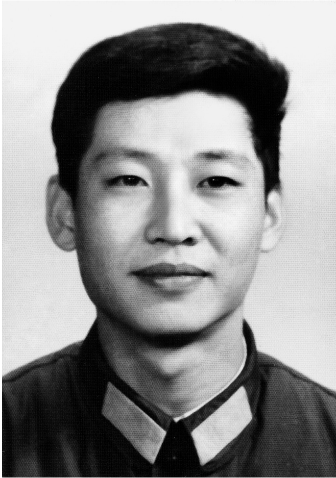
Ova fotografija je snimljena 1979, kad je radio u Glavnoj kancelariji Centralne vojne komisije.