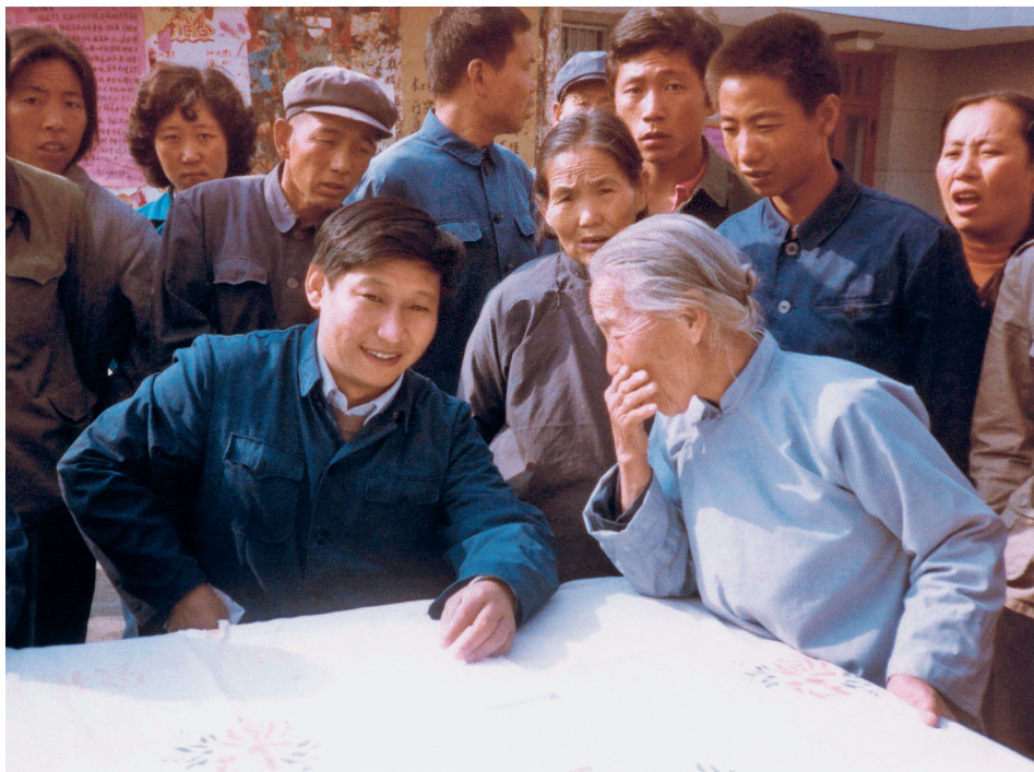
Godine 1983, Si Dingping, sekretar Okružnog komiteta KPK u Džengdingu u pokrajini Hebej, postavio je sto na ulici da čuje mišljenje građana.