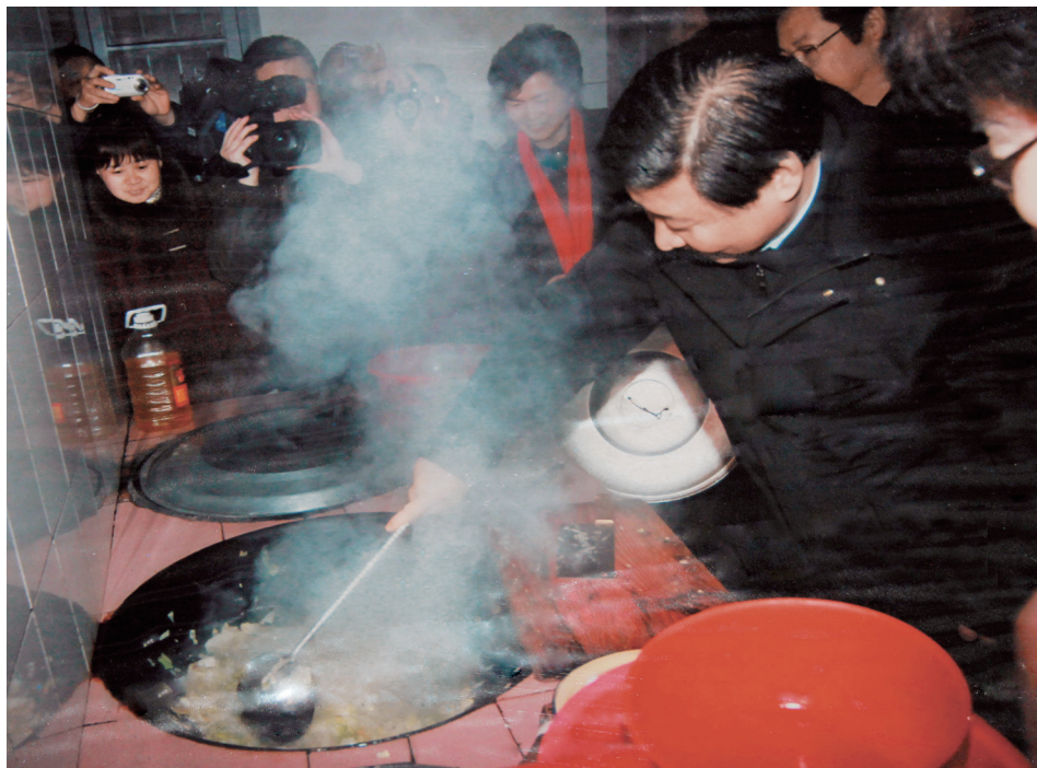
Tokom posete staračkom domu u Pingduu, u srezu Čingjuen u pokrajini Džeđiang, u januaru 2007, kuvao je za stare. U to vreme bio je sekretar Pokrajinskog komiteta KPK u Džeđiang.