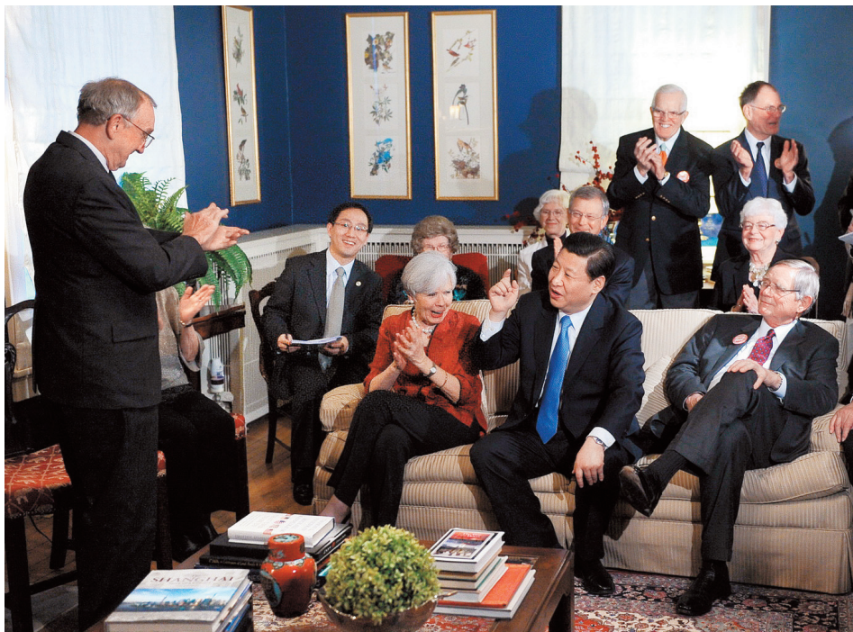
Sa američkim prijateljima s kojima se upoznao dvadeset sedam godina ranije, u ponovnoj poseti Ajovi, u februaru 2012.