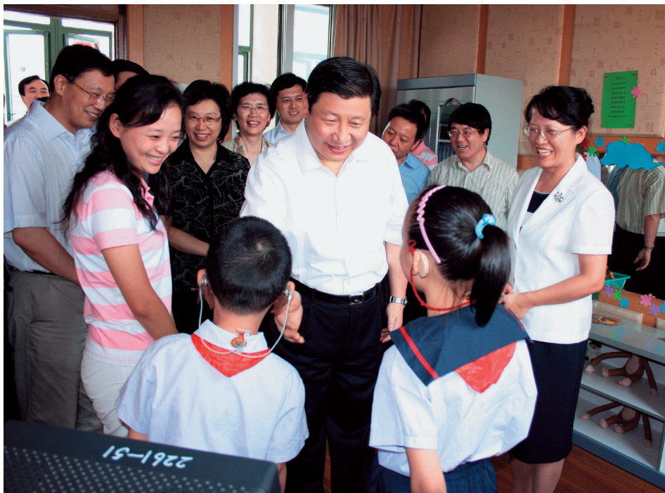
U razgovoru sa decom oštećenog sluha u školi Čijin u opštini Minhang u Šangaju, u septembru 2007. U to vreme bio je sekretar Gradskog komiteta KPK u Šangaju.