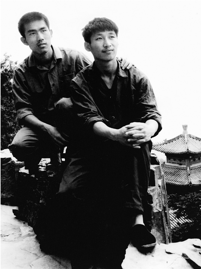
Ova fotografija je snimljena 1977, kad je bio student na univerzitetu Cinghua (desno).