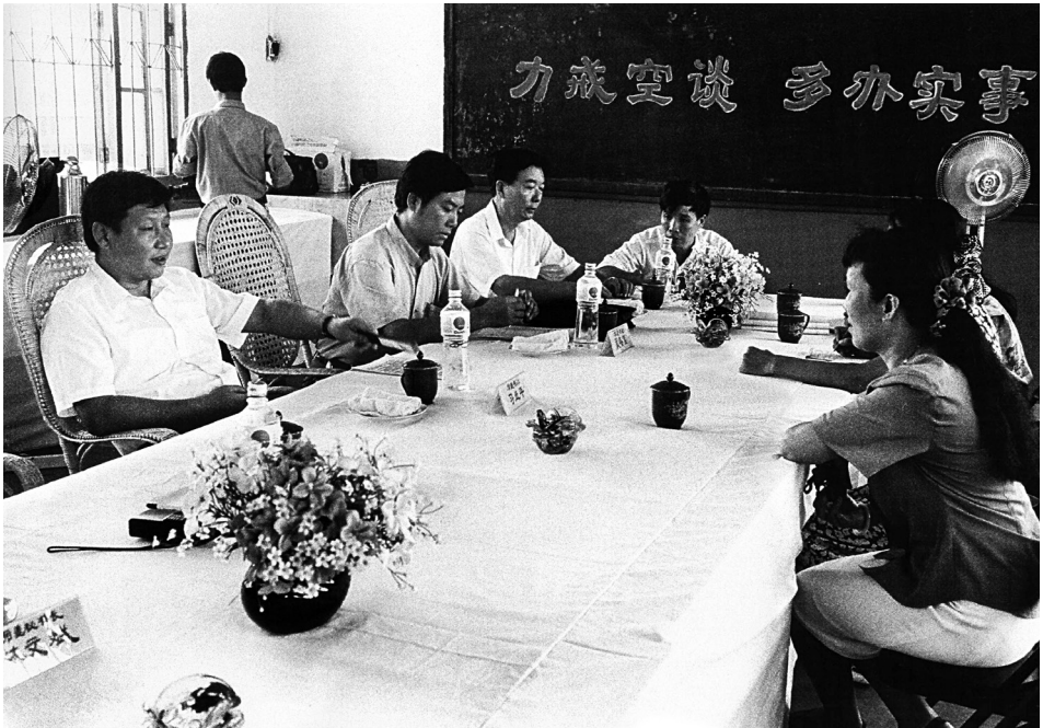
Avgusta 1993 , Si Đinping, sekretar Gradskog komiteta KPK u Fudžouu u pokrajini Fudžian primio je građane zajedno sa funkcionerima grada Fudžoua i opštine Taijianga na dan zakazan u tu svrhu.