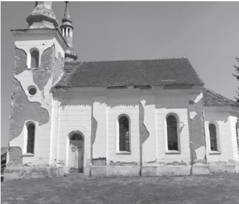
Црква у Козарцу

Гавро и један његов ђак су се из описане ступице некако извукли, за разлику од коња. Али то овог поносног човека не да није поколебало, него је после тога решио