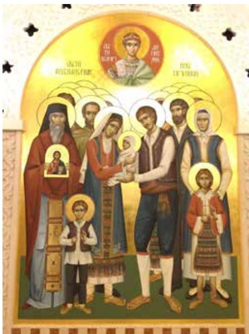
Фреска у храму на Врачару у Београду. Представља једну вишечлану породицу из Пребиловаца. Фреска се налази на сјевероисточном зиду Храма светог великомученика кнеза Лазара који се налази испод Светосавског храма. Аутори композиције Пребиловачки новомученици су Владимир Д. Карановић и Вероника В. Ђукановић

мученика коју је урадио у параклису храма. Уз фреску Долазак Светиој Василији Острошкој у Храму Светог Преображења у Требињу од 44 квадратна метра, ова фреска од 30 квадрата друга је по величини у свеколиким православним храмовима.