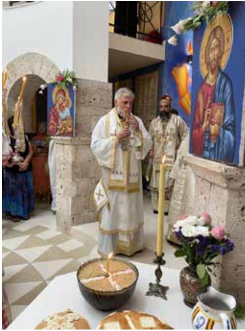
Владика диселдорфски и свењемачке Григорије у храму Васкрсења Христовог у Пребиловцима 6. августа 2022. године

„Да ли сте некада били у Херцеговини у августу?