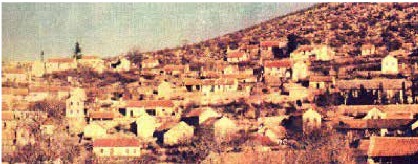
Пребиловци, 1974

Ипак, питање постанка Пребиловаца, поријекла њиховог назива још није одгонетнуто. Многа околна насеља су поменута у историјским документима, старим и преко 800 година, под садашњим називима. Пребиловаца под овим или сличним именом нема све до 1701. године.