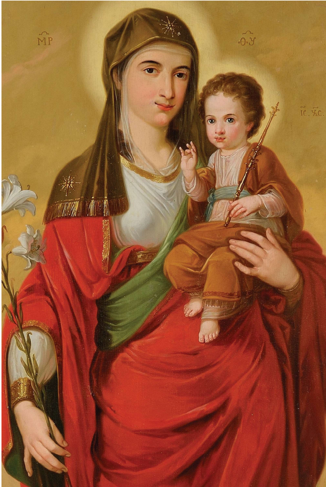
Бојородица са Христџом (деталј), икона са иконостаса српске цркве у Табану, 1820. год., Арсеније Теодоровић, уље на платну, каширано на дрвену подлогу