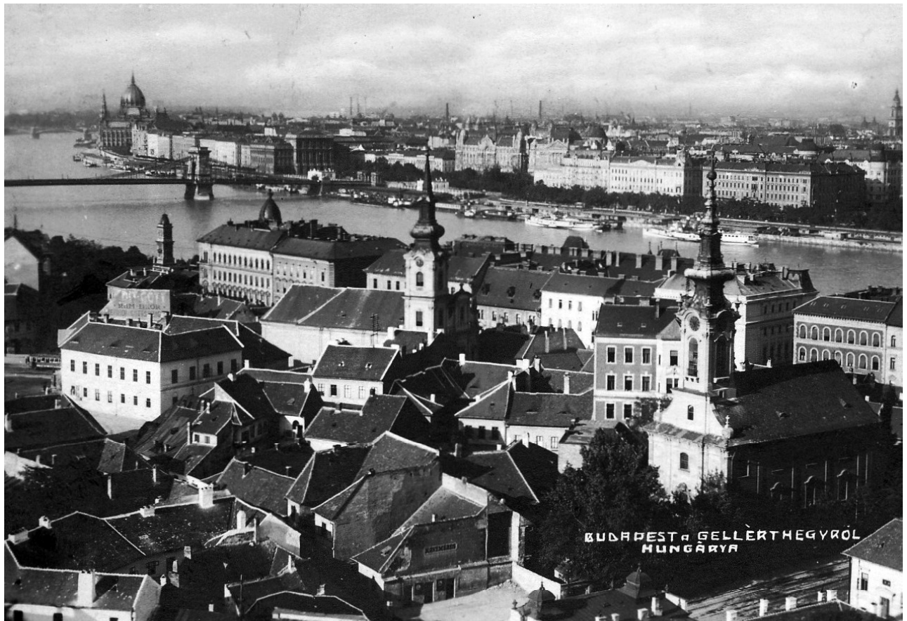
Поглед на Табан са Гелертовог брда, 1930. год.