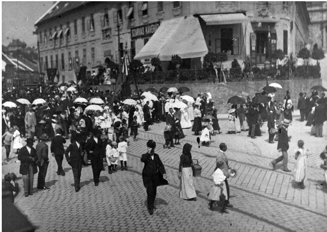
Трг Јелена у Табану, 1912. год.