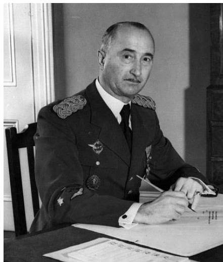
Генерал Душан Симовић

„На основу извештаја швајцарске штампе из Лондона, генерал Симовић, председник избегличке југословенске владе је разрешен а вођство владе у сенци је преузео Јовановић, бивши министар правде.“