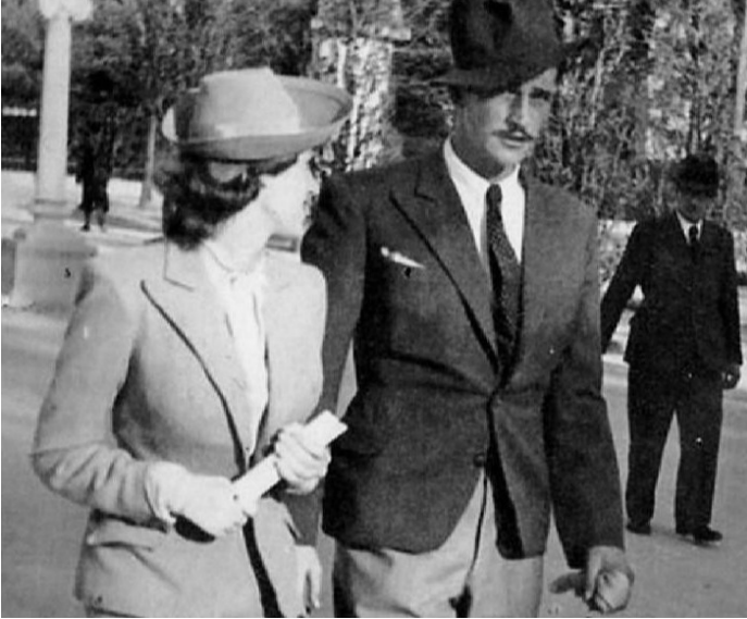
Između dva rata

ubije. Uz sve to, stiže i da položi sve ispite na Građevinskom fakultetu, ali ne i da diplomira. Dolazi novi rat.