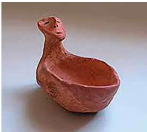
Антропоморфна ваза са Борђоша, Музеј Војводине