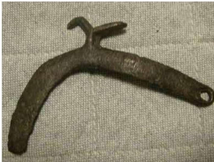
Бронзани привесак са орнитоморфним детаљем са локалитета Борђош