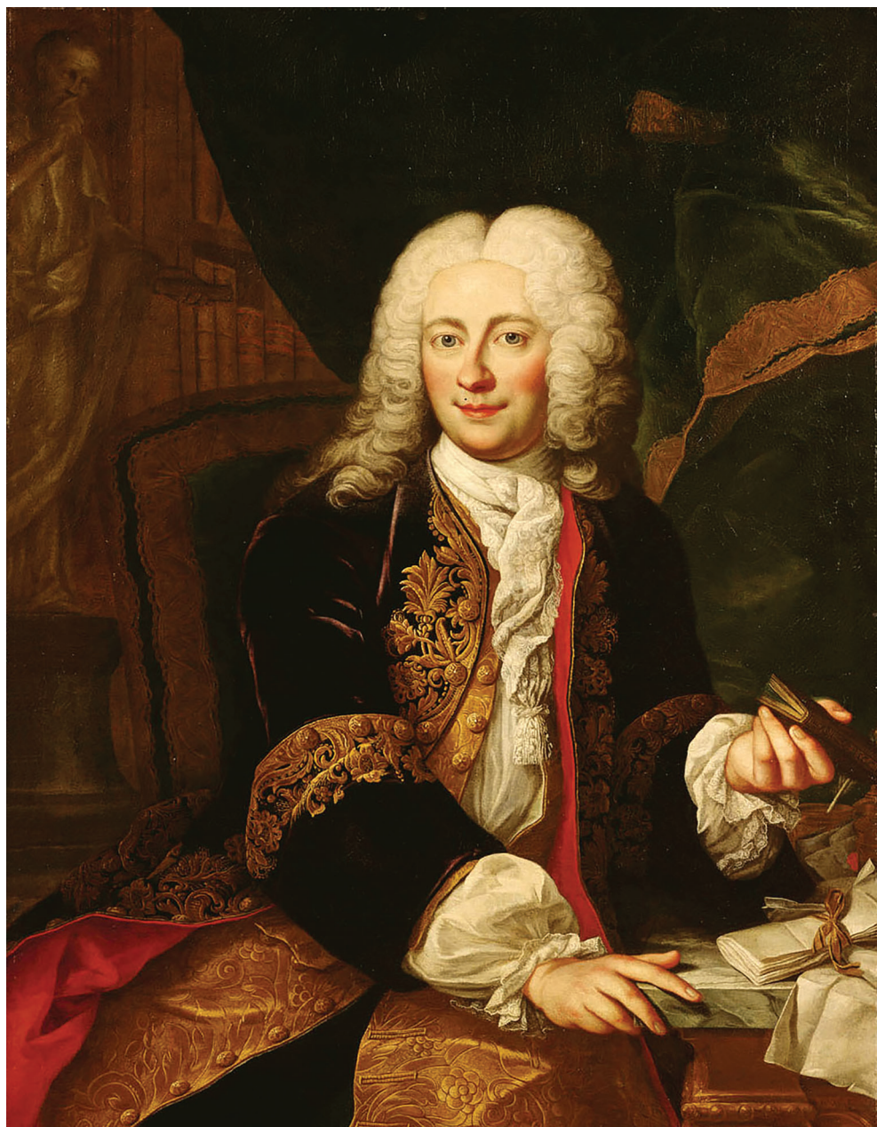
МАРТИН ВАН МАЈТЕНС: ГРОФ ЈОХАН КРИСТИЈАН БАРТЕНШТАЈН