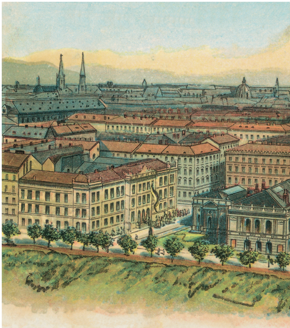
ПАНОРАМА БЕЧА ИЗ 1873. ГОДИНЕ

раздобља српске историје. Поред свега осталог што је мењало слику целокупног српског друштва, односно доводило до настајања и развијања новог грађанског слоја, Срби су стекли и нову црквену организацију – Карловачку митрополију, која ће битно утицати и на прихватање барокне културе у Срба. Већ у првој половини XVIII века на подручју аустријске