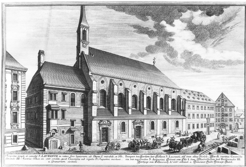
СЕДИШТЕ ИЛИРСКЕ ДВОРСКЕ КАНЦЕЛАРИЈЕ