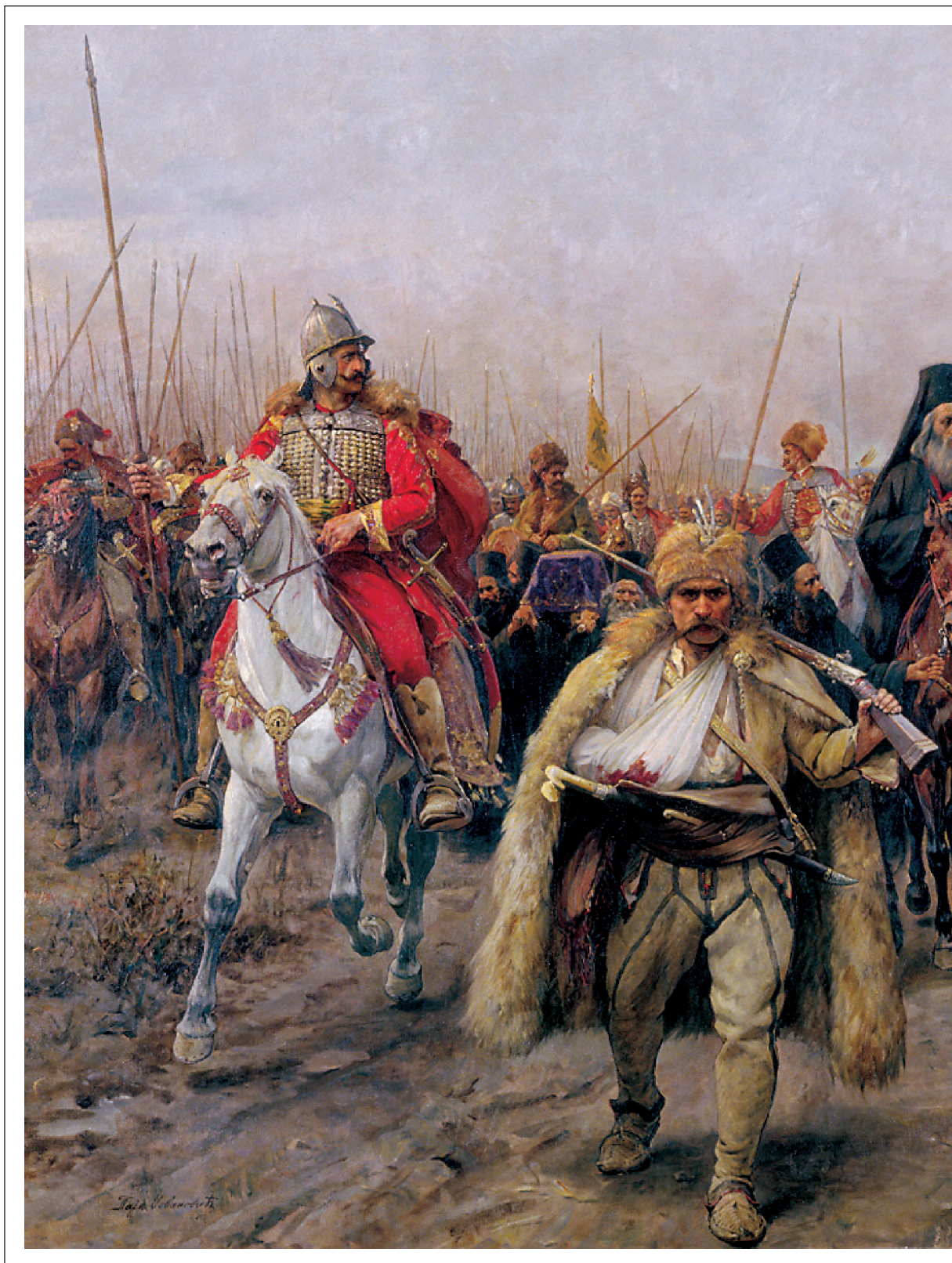
ПАЈА ЈОВАНОВИЋ: СЕОБА СРБА, 1895.