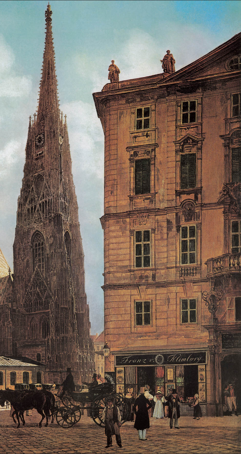
Рудолф Алт: КАТЕДРАЛА СВЕТОГ СТЕФАНА, 1834.